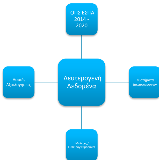
Σχήμα 1: Πηγές δευτερογενών δεδομένων

Ως πηγή δεδομένων χρησιμοποιήθηκε το Σύστημα Παρακολούθησης των Δικαιούχων της Διεύθυνσης Ειδικής Αγωγής (στοιχεία της εν λόγω Διεύθυνσης). Ειδικότερα, μέσω του συστήματος χρησιμοποιήθηκαν στοιχεία για τον αριθμό των ωφελούμενων που εξυπηρετήθηκαν ανά δράση, κατά τη διάρκεια των ετών υλοποίησης και κατά φύλο.