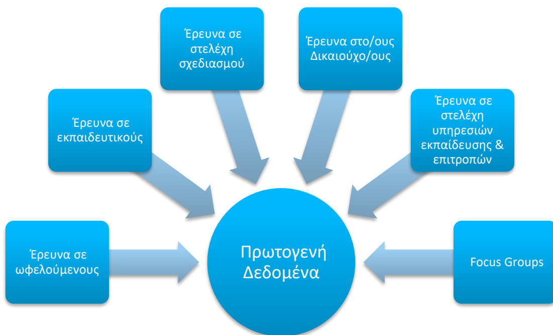
Σχήμα 3: Πηγές πρωτογενών δεδομένων